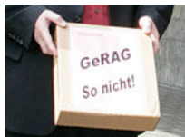
Eine Schachtel voll Kritik

Diese Solidarität sei mit der Gemeindereform Aargau (Gerag) – weniger Finanzausgleich, dafür Geld für Fusionen – in Gefahr. Das befürchtet das Komitee «für Gemeindeautonomie und einen solidarischen Aargau».